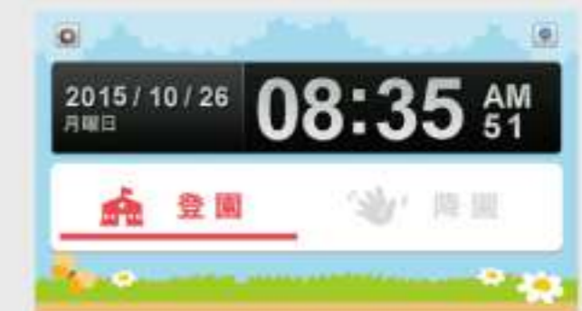
2ステータスモード [登園：降園]