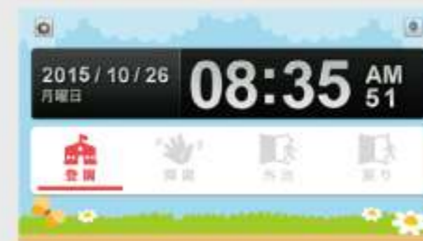
4ステータスモード [登園：降園：外出：戻り]