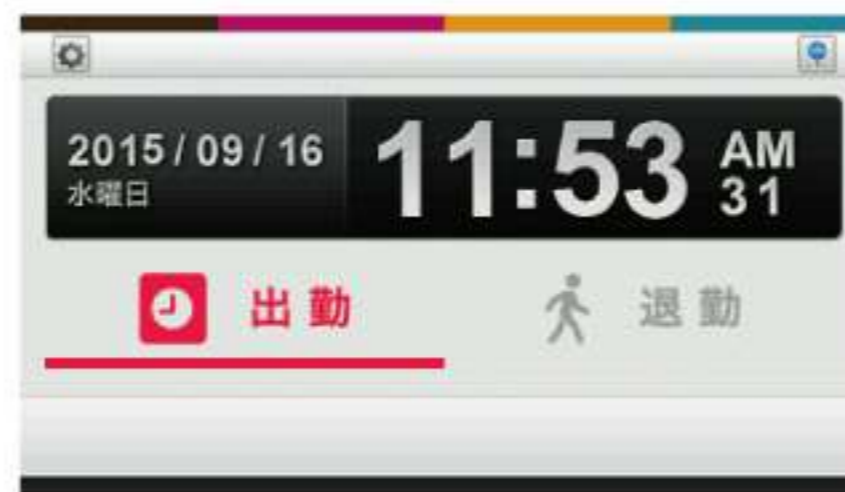
2ステータスモード